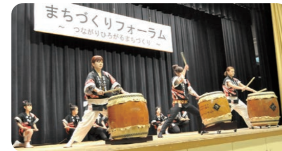
「なかよし太鼓」の発表

●「文化事業部会」→「なかよし太鼓」の育成と「畑体験事業」を実施。「なかよし太鼓」は、発表の場も増えて認知度が上がった。「畑体験事業」では、収穫を楽しむだけでなく、世代を超えて土と触れ合う機会を持つことができた。