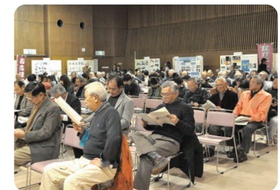
各団体の発表を熱心に聞く皆さん